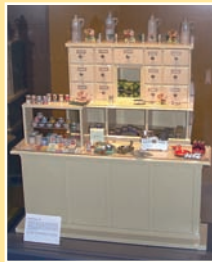
Kinderkaufladen von 1946

Die Ausstellung „Supermarkt der Jahrhundertwende“ informiert über die Geschichte eines Friedberger Kolonial-