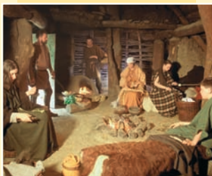
Nachgestellte Alltagsszene einer keltischen Familie

Die archäologische Abteilung zeigt einen Überblick über heimische Kulturen von der Steinzeit bis ins frühe Mittelalter. Dabei wird deutlich, dass die geographisch günstig gelegene und äußerst fruchtbare Landschaft der Wetterau durch die Zeiten eine kulturgeschichtlich bedeutende Rolle spielt.