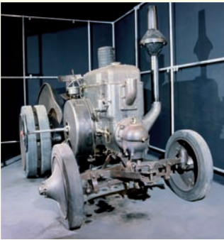
Lanz-Bulldog von 1927

Die Ausstellung „Von der Sichel zur Dreschmaschine“ stellt die Geschichte der Landwirtschaft in der Wetterau von 1800 bis 1950 dar, als rasante technische Entwicklungen weit reichende soziale Veränderungen nach sich zogen.