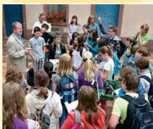
Projekt „Friedberg macht Schule“ 2011 im Hof des Wetterau-Museums

Nicht nur für Schulklassen bietet das Wetterau-Museum mit seinen Sammlungen und Ausstellungen zahlreiche Anknüpfungsmöglichkeiten für den Heimat- oder Sachkundeunterricht in der Grundstufe oder die Fächer Geschichte, Politik & Wirtschaft oder Kunst in der Sekundarstufe 1 und 2. Die Beschäftigung mit der Geschichte und Kultur der eigenen Stadt und Region bildet eine entscheidende Grundlage. Allgemeine geschichtliche Themen können am heimischen Beispiel konkret und nah an der eigenen Lebenswelt vermittelt werden. Durch nichts zu ersetzen ist beim Museumsbesuch der unmittelbare Kontakt mit originalen materiellen Zeugnissen unserer Geschichte und Kultur. Die Möglichkeiten der Vermittlung sind vielfältig und altersgerecht: neben der klassischen Führung reicht das Spektrum von der spielerischen Erkundung über Workshops, Fragebögen und Aufgaben bis zur Projektarbeit. Themen und Herangehensweise können im Vorfeld mit den Museumsmitarbeitern individuell abgestimmt werden.