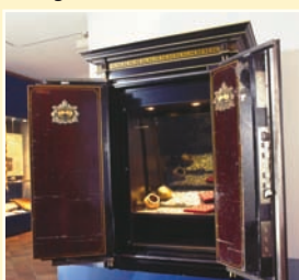
Römischer Münzschatz in Gründerzeit-Tresor

Nicht nur für Schulklassen bietet das Wetterau-Museum mit seinen Sammlungen und Ausstellungen zahlreiche Anknüpfungsmöglichkeiten für den Heimat- oder Sachkundeunterricht in der Grundstufe oder die Fächer Geschichte, Politik & Wirtschaft oder Kunst in der Sekundarstufe 1 und 2. Die Beschäftigung mit der Geschichte und Kultur der eigenen Stadt und Region bildet eine entscheidende Grundlage. Allgemeine geschichtliche Themen können am heimischen Beispiel konkret und nah an der eigenen Lebenswelt vermittelt werden. Durch nichts zu ersetzen ist beim Museumsbesuch der unmittelbare Kontakt mit originalen materiellen Zeugnissen unserer Geschichte und Kultur. Die Möglichkeiten der Vermittlung sind vielfältig und altersgerecht: neben der klassischen Führung reicht das Spektrum von der spielerischen Erkundung über Workshops, Fragebögen und Aufgaben bis zur Projektarbeit. Themen und Herangehensweise können im Vorfeld mit den Museumsmitarbeitern individuell abgestimmt werden.